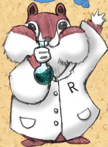
理数科マスコット「アマリス」