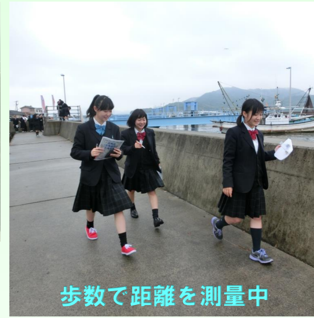
歩数で距離を測量中