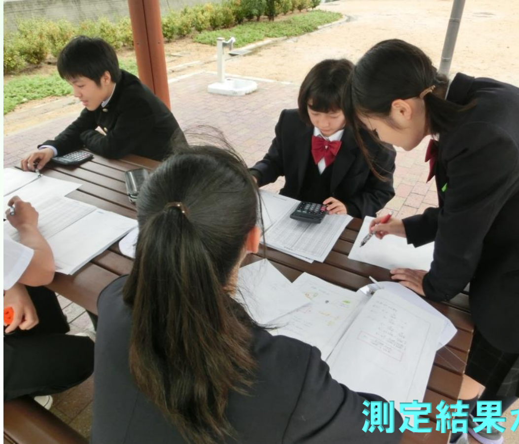
測定結果から計算中