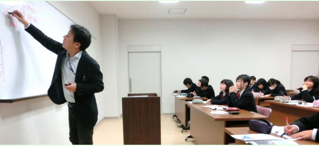
理論と測定手法の勉強です

1日目 <科学・数学研修> 高校生と中学生が合同で、科学と数学のコラボレーション研修「三角測量と数学」を実施しました。