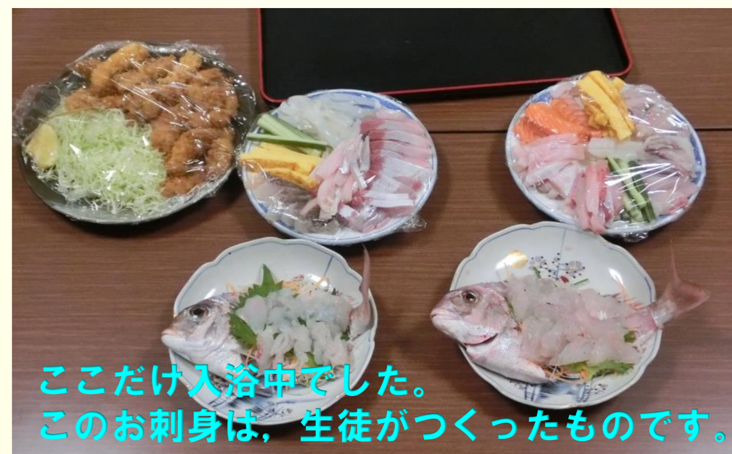
ここだけ入浴中でした。 このお刺身は、生徒がつくったものです。

平成27年11月14日(土)～15日(日)の1泊2日、理数科高校生1年生2名と中学生1～3年生23名が、福山市内海町(田島、横島という2つの島)で、「中高一緒に科学する」「農漁業を体験する」をテーマに科学宿泊研修を行いました。科学研修では、自作六分儀と数学の三角比を用いて港の沖合にある防波堤までの距離を測量と計算から導き出す研修や関数を用いた数学の面白さを研修しました。民泊体験は、多くの生徒が初めての経験。一瞬の緊張はありましたが、暖かい家庭の対応にすぐに打ち解けました。