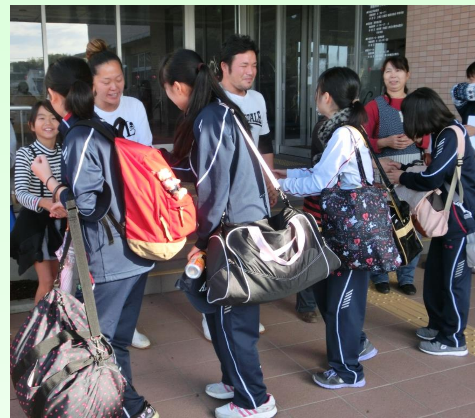
ようこそ内海・沼隈へ 出会えばみんな家族 いい島 いい町 いい出会い

<箱崎漁港 定置網漁体験研修> 研修はまだ続きます。3艘の漁船に分かれ、定置網漁を体験しました。80cmのハマチに歓喜!