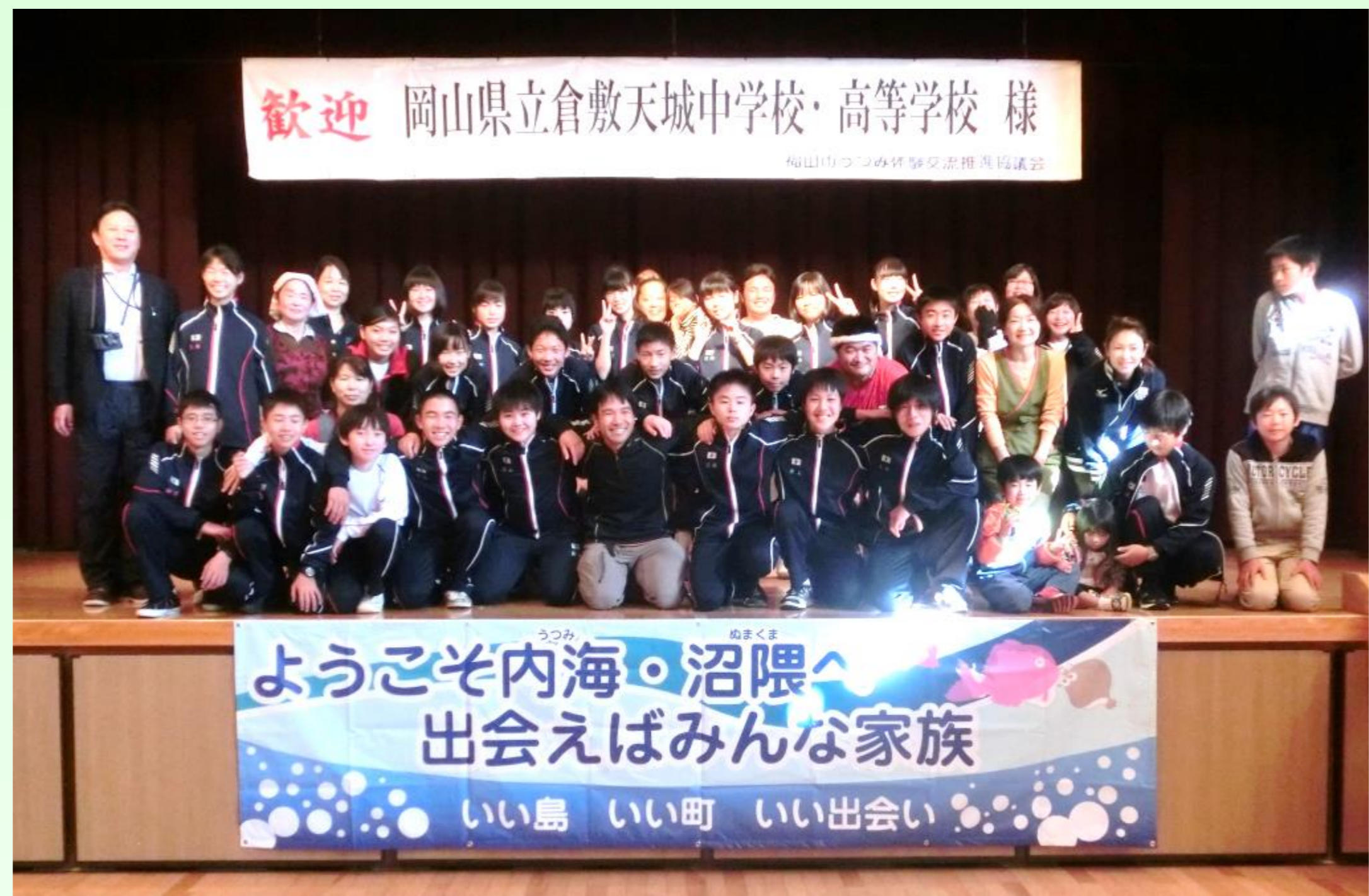
歓迎 岡山県立倉敷天城中学校・高等学校 様