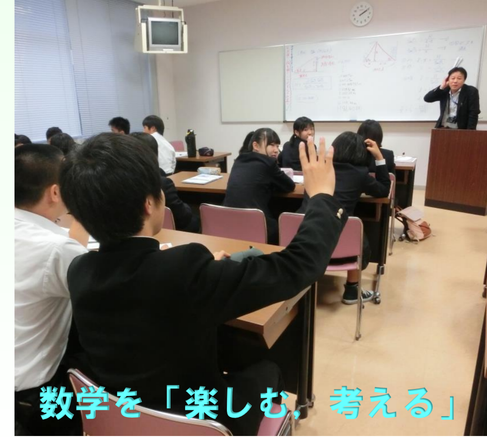
数学を「楽しむ」考える

<入島式と民泊ホストとの対面式> 想像以上の歓迎を受けました。民泊ホストとの対面。緊張は「一瞬」、すぐ和やか雰囲気。