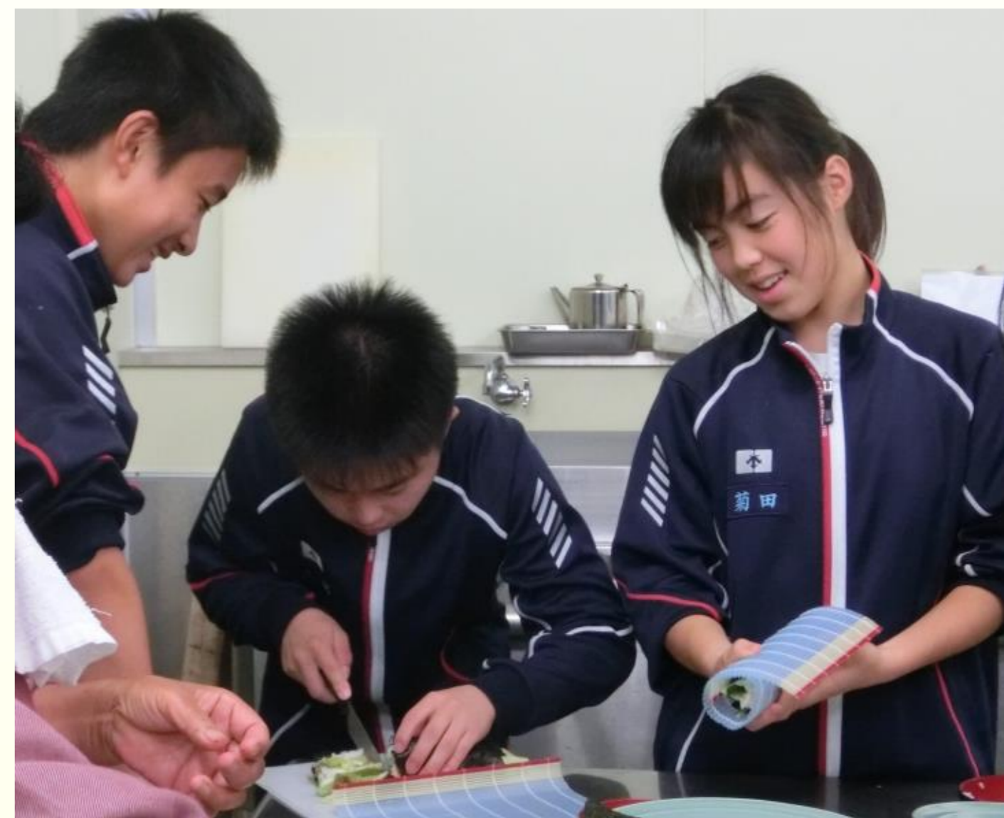
副校長も自分の飯は自分でつくる