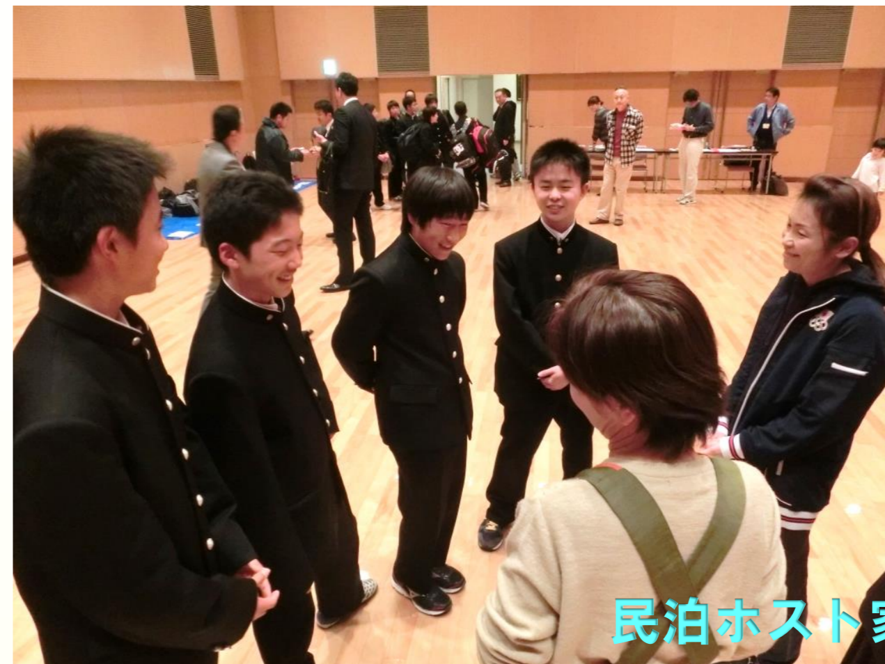
民泊ホスト家族との初対面