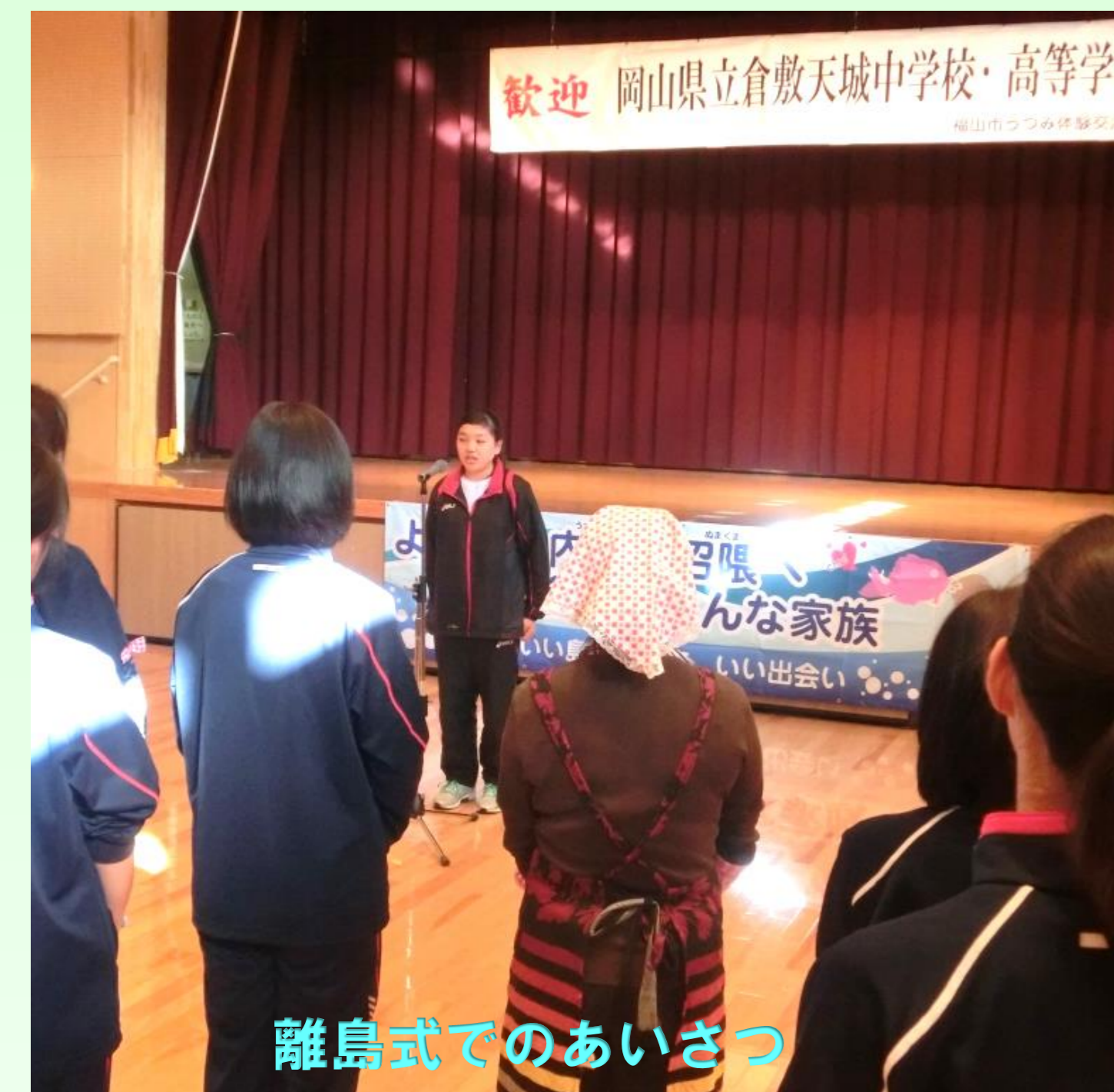
離島式でのあいさつ

2日目 <離島式> 民泊ホスト家族とのお別れです。たった1泊でしたが、家族同様の暖かい対応と未知の体験に感謝です。