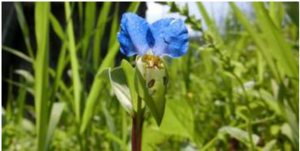
ツクサ (ツクサ科) Commelina communis L.