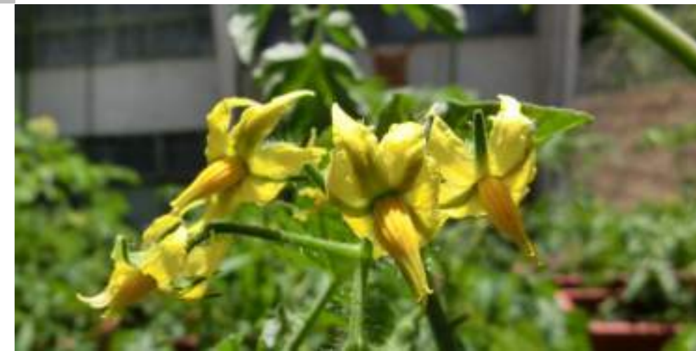
トマト (ナス科) Solanum lycopersicum