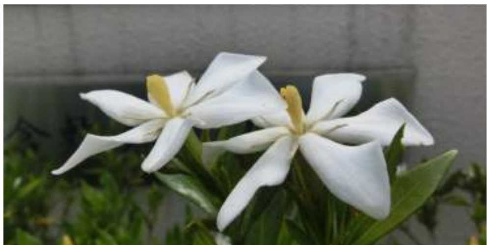
クチナシ (アカネ科) Gardenia jasminoides Ellis