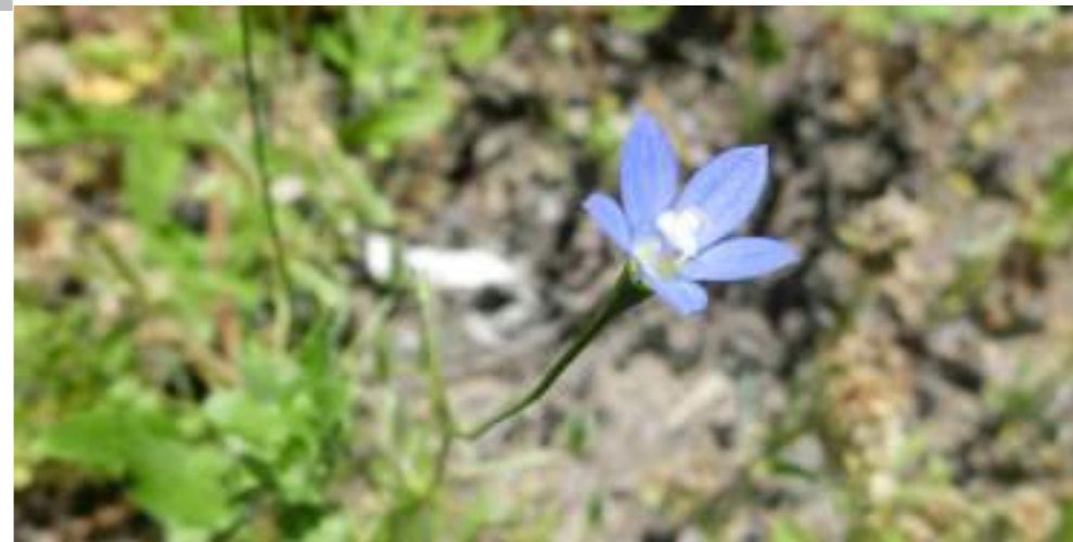
ヒナギキョウ (キキョウ科) Wahlenbergia marginata virginica