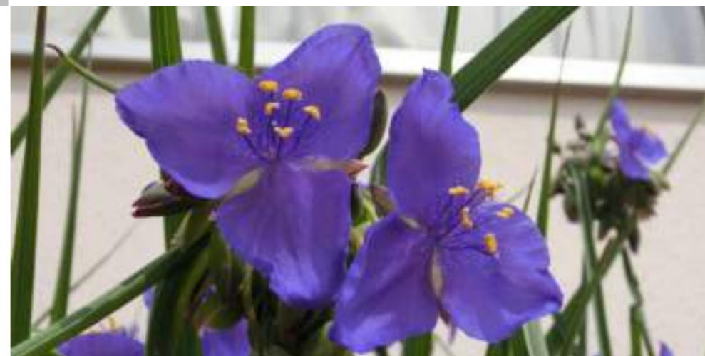
ムラサキツクサ (ツクサ科) Tradescantia ohiensis