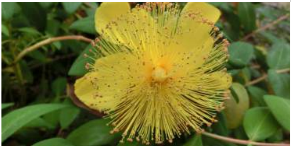
セイヨウキンシバイ (オトギリソウ科) Hypericum calycinum