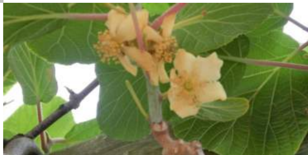
キウイ (キウイフルーツ) (マタタビ科) Actinidia deliciosa