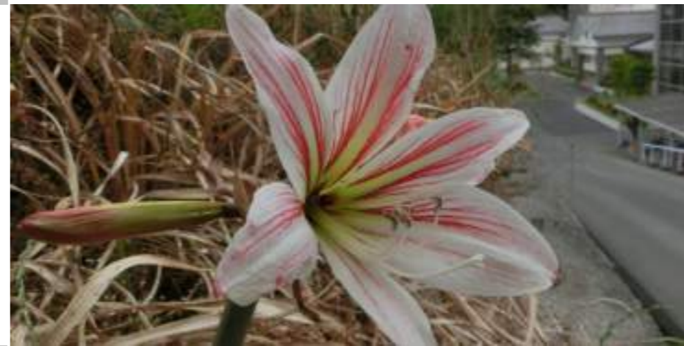
ユリSP. (ユリ科) Lilium L.