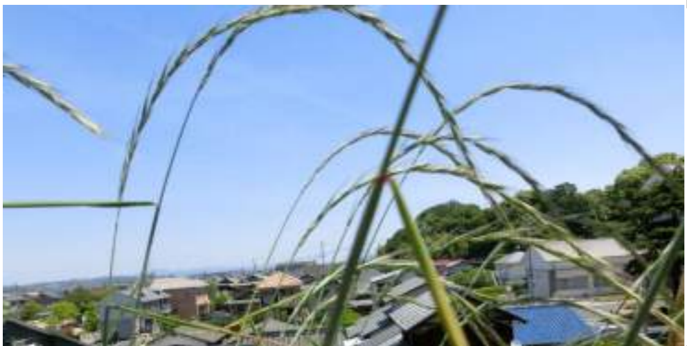
カモジグサ (イネ科) Elymus tsukushiensis var. transiens