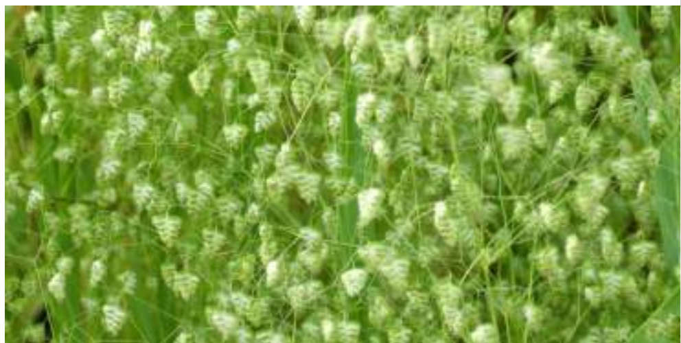
ヒメコバンソウ (イネ科) Briza minor L.