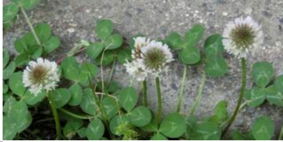
シロツメグサ (マメ科) Trifolium repens L.