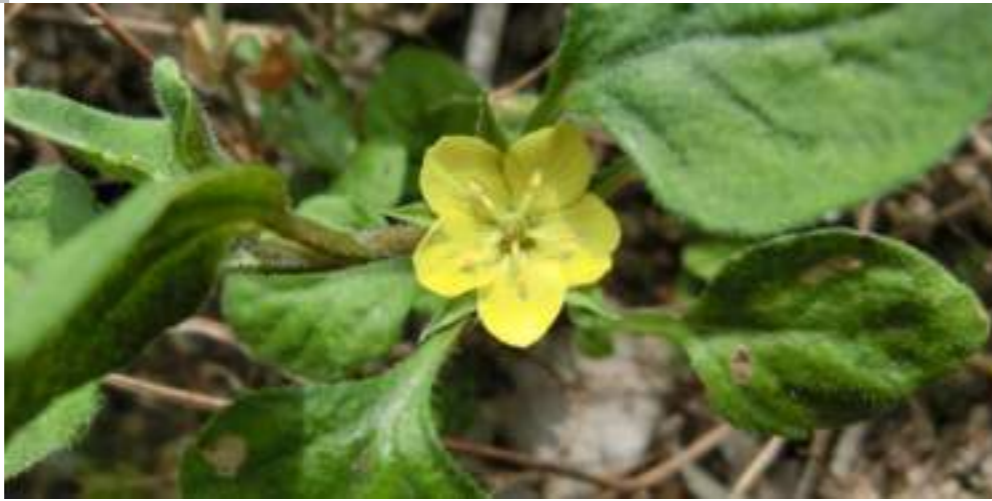
コナスビ (サクラソウ科) Lysimachia japonica f. subsessilis