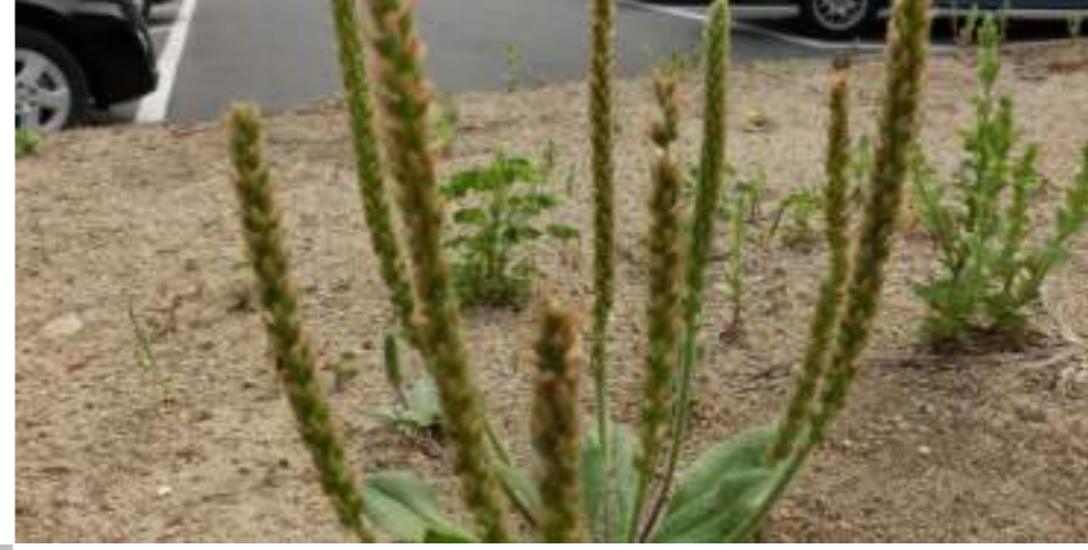
オオバコ (オオバコ科) Plantago asiatica L.