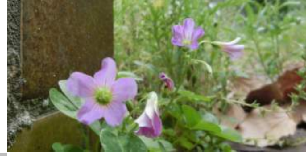
ムラサキカタミ (カタバミ科) Saxifraga stolonifera DC.