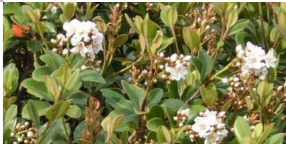
シャリンバイ (バラ科) Raphiolepis indica var. umbellata