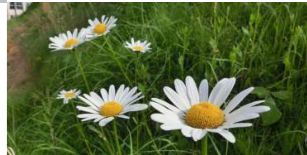
マーガレット (キク科) Argyranthemum frutescens L.