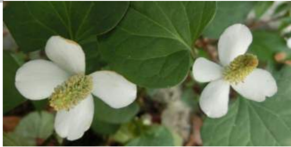
ドクダミ (ドクダミ科) Houttuynia cordata