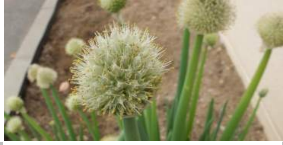
「ネギボウス」 (ユリ科) Allium fistulosum