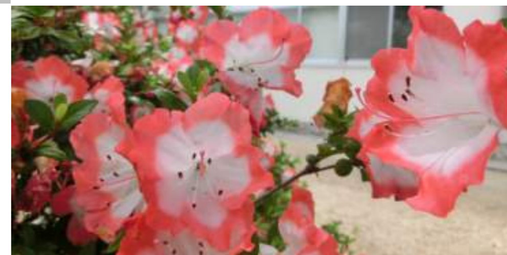
ツツジSP. (ツツジ科) Rhododendron