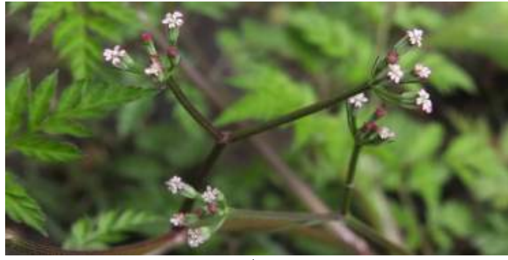
オヤジラミ (セリ科) Torilis scabra (Thunb.) DC.

「5月(ちょっと6月も), 校庭によく見られる草花(含, 木本)を集めました。」