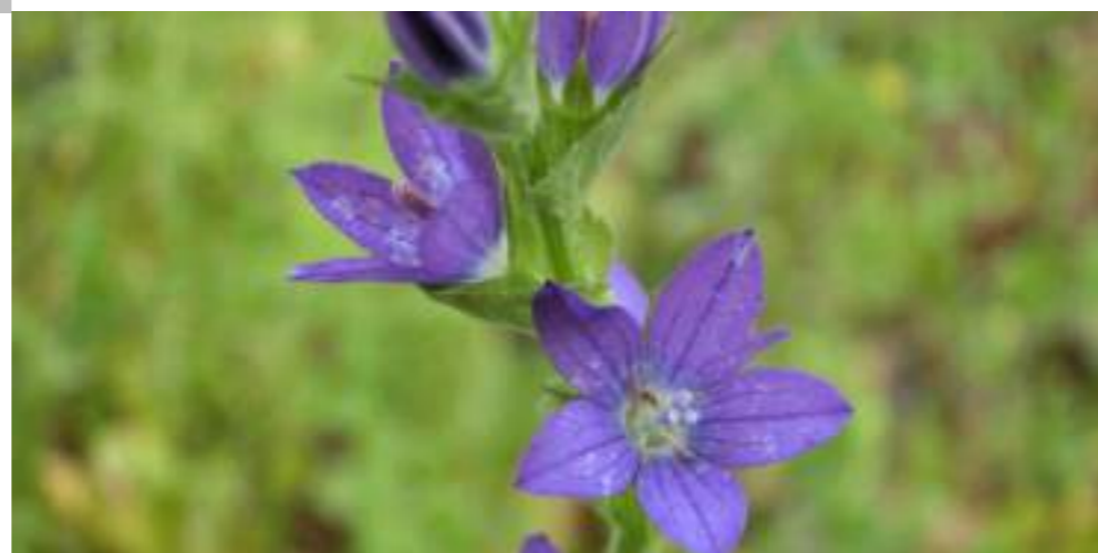
キキョウソウ (キキョウ科) Triodanis perfoliata Nieuwl.