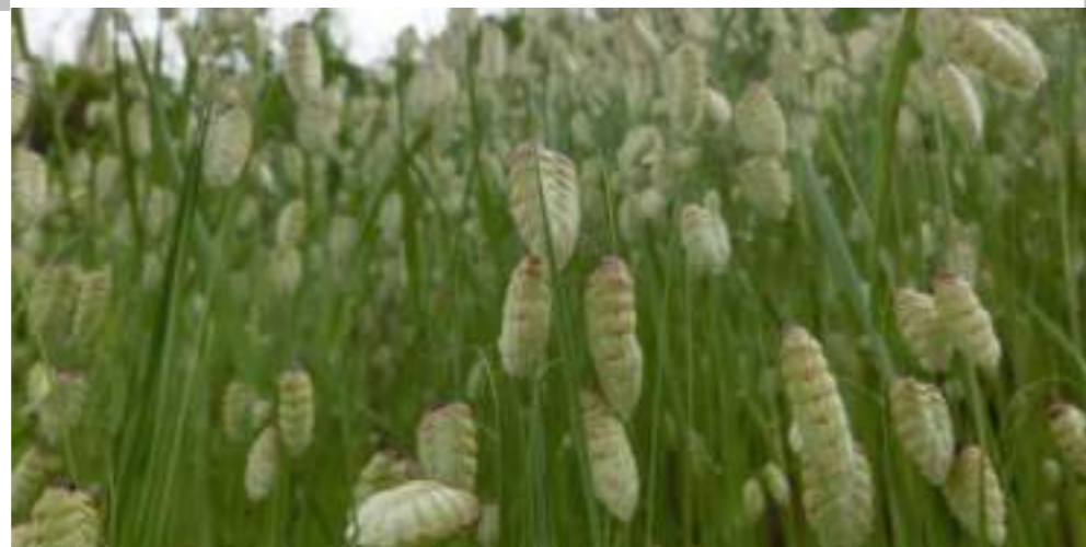
コバンソウ (イネ科) Briza maxima L.