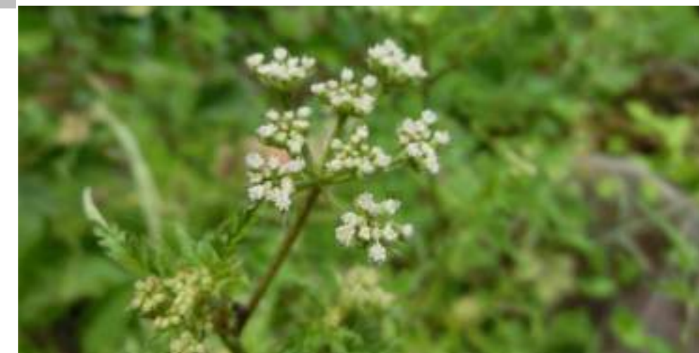
ヤジラミ (セリ科) Torilis japonica (Houtt.) DC.