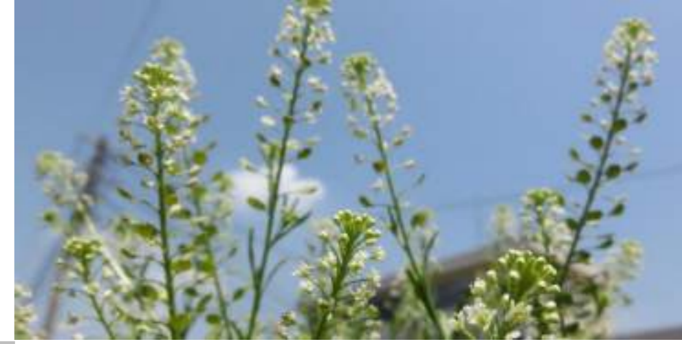
マメゲンバイナズナ (アブラナ科) Lepidium virginicum L.