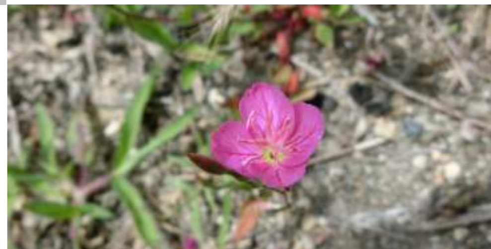
アカバナユウゲショウ (アカバナ科) Oenothera rosea