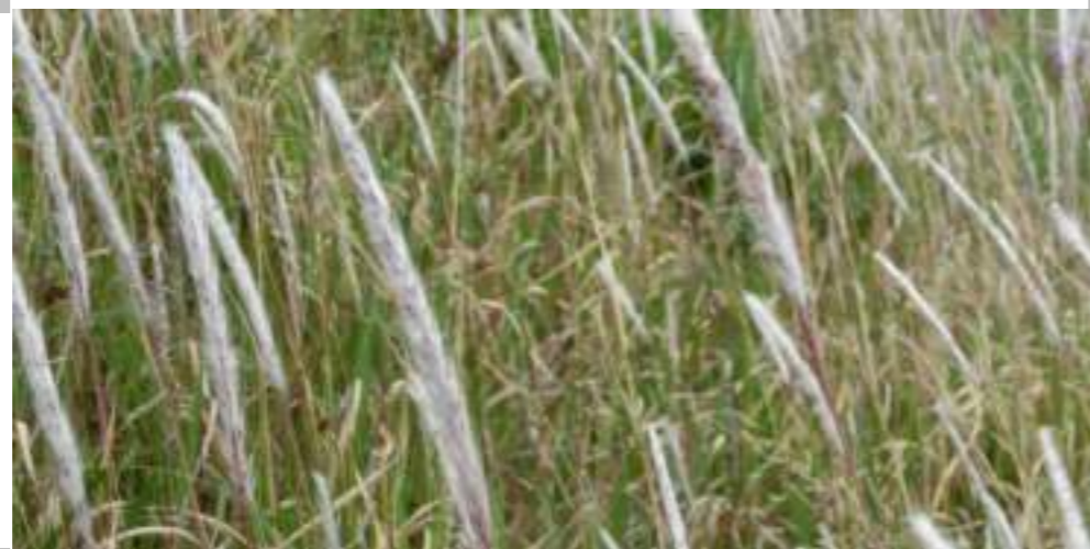
チガヤ (イネ科) Imperata cylindrica L.