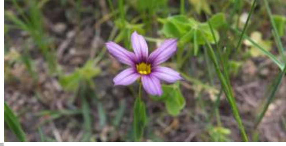
ニワゼキショウ (アヤメ科) Sisyrinchium rosulatum E.P.Bicknell