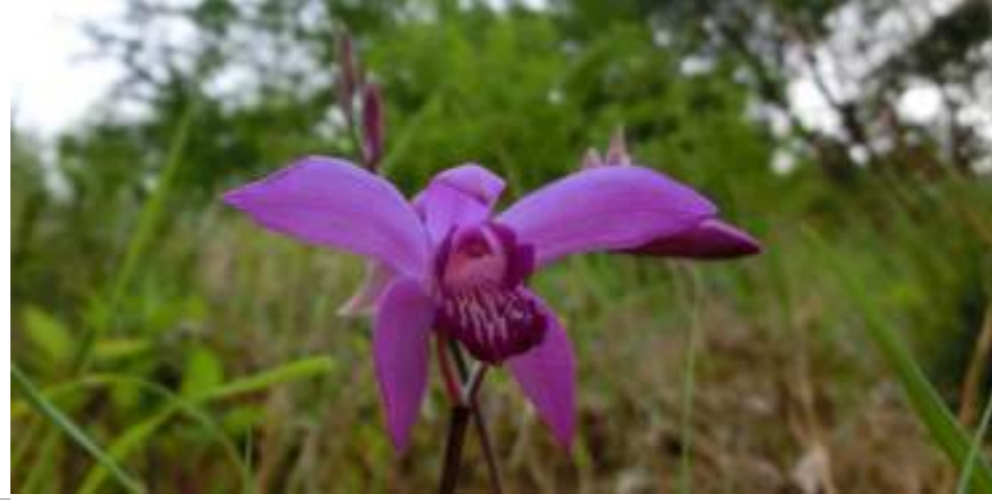
シラン (ラン科) Bletilla striata Reichb. fil