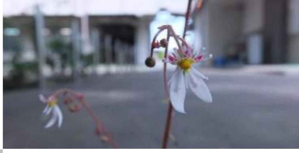
ユキノシタ (ユキノシタ科) Saxifraga stolonifera C.