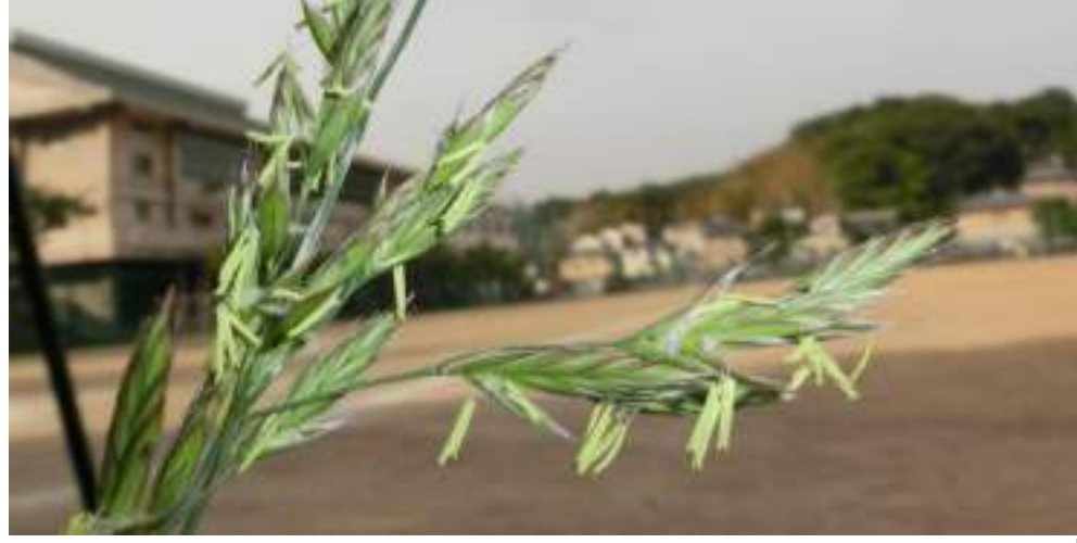
カラスムギ (イネ科) Avena fatua