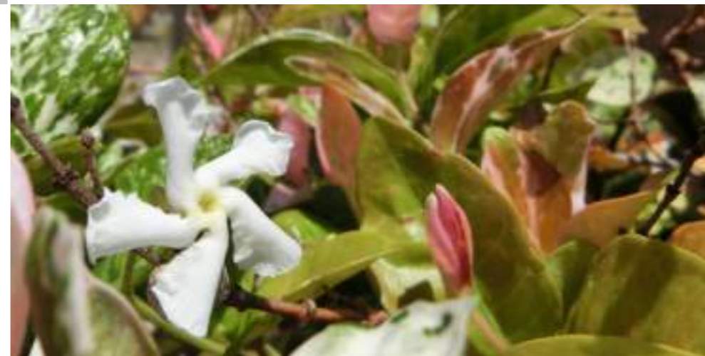
ハツユキカズラ (キョウチクトウ科) Trachelospermum asiaticum "Hatuyukikazura"