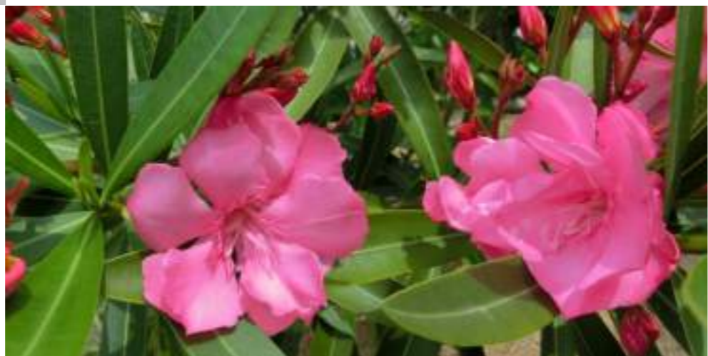
キョウチクトウ (キョウチクトウ科) Nerium oleander var. indicum