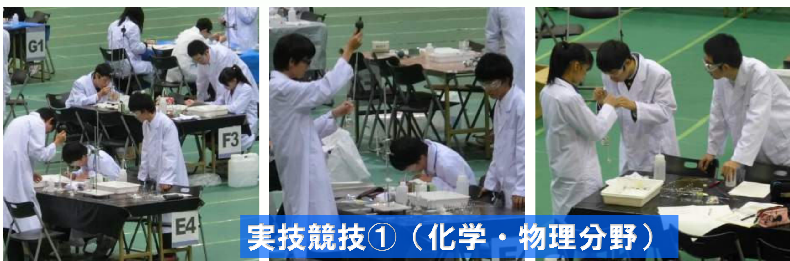
実技競技①（化学・物理分野）