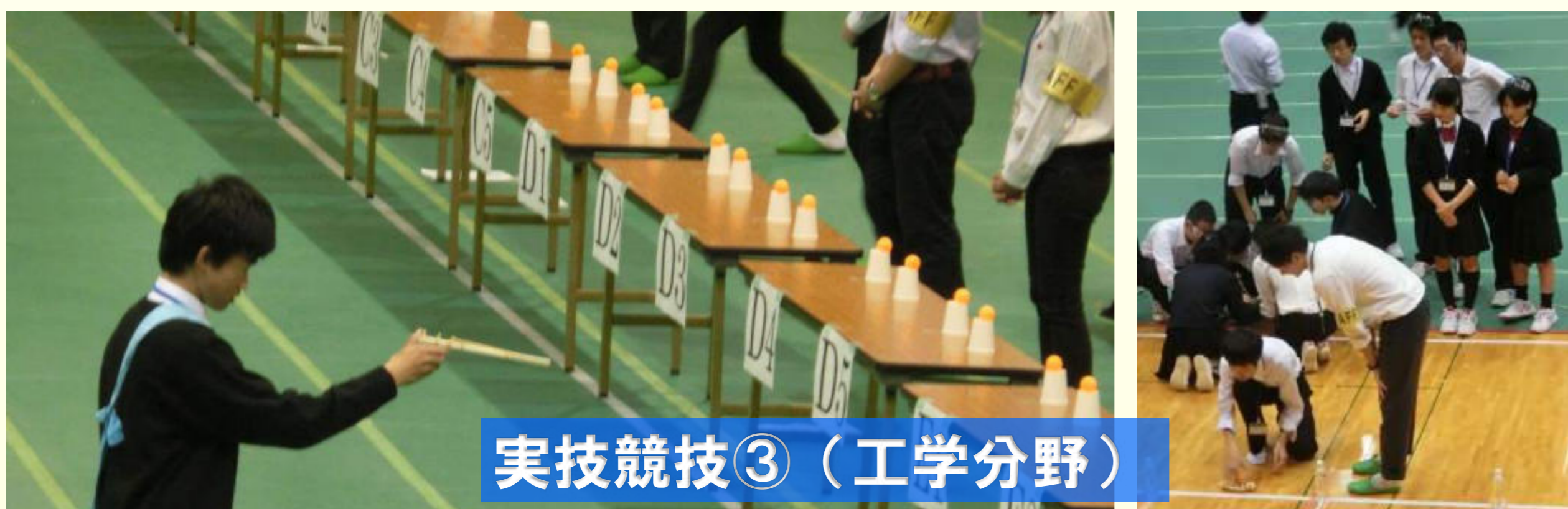
実技競技③（工学分野）

平成27年10月24日(土)、サイエンスチャレンジ岡山2015(兼、「科学の甲子園」予選)が、総社市の「きびじアリーナ」を会場に行われた。全県から39チームが、本校からは「天城のSay Yeah!」、「一酸化二水素」の2チームが参加した。科学的思考や工学技術に関する複合競技(筆記、物理・化学実技、生物・地学実技、工学実技)に熱戦が繰り広げられた。その結果、本校「天城のSay Yeah!」チームが惜しくも、第2位となった。「科学の甲子園」本選への進出とはならなかったが2チームとも大！健闘した。