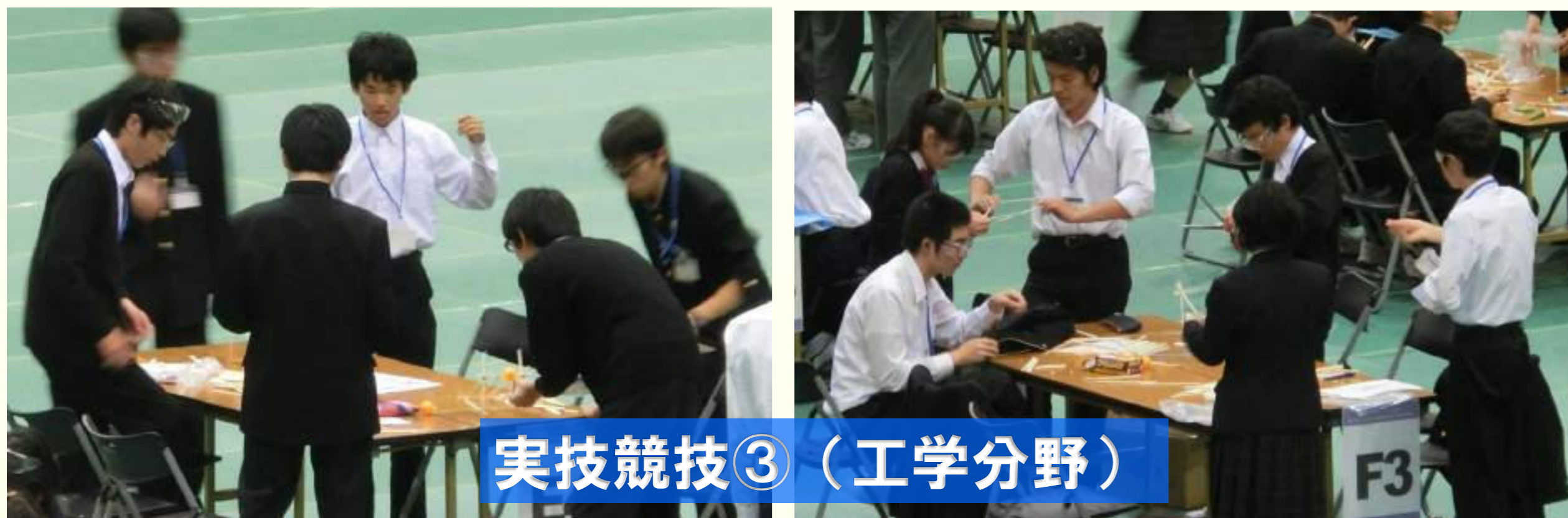
実技競技③（工学分野）