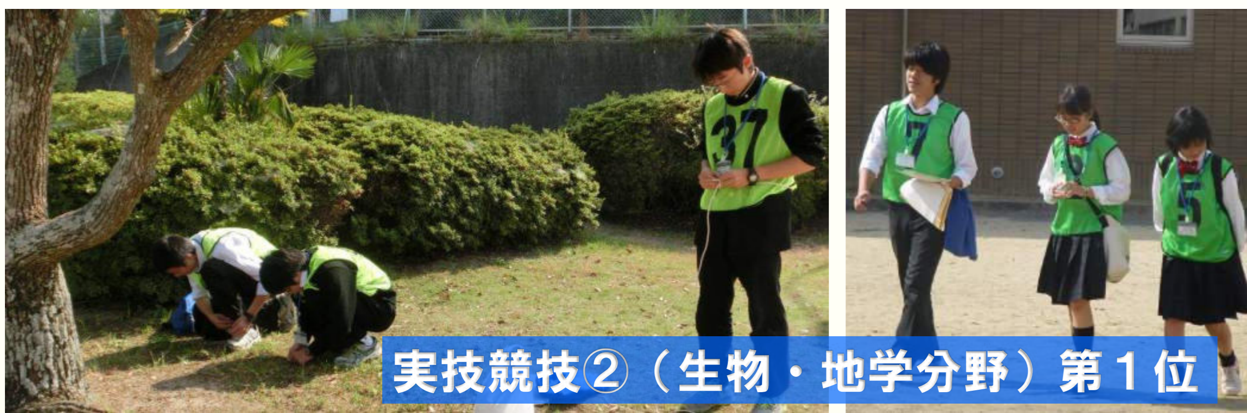
実技競技②（生物・地学分野）第1位