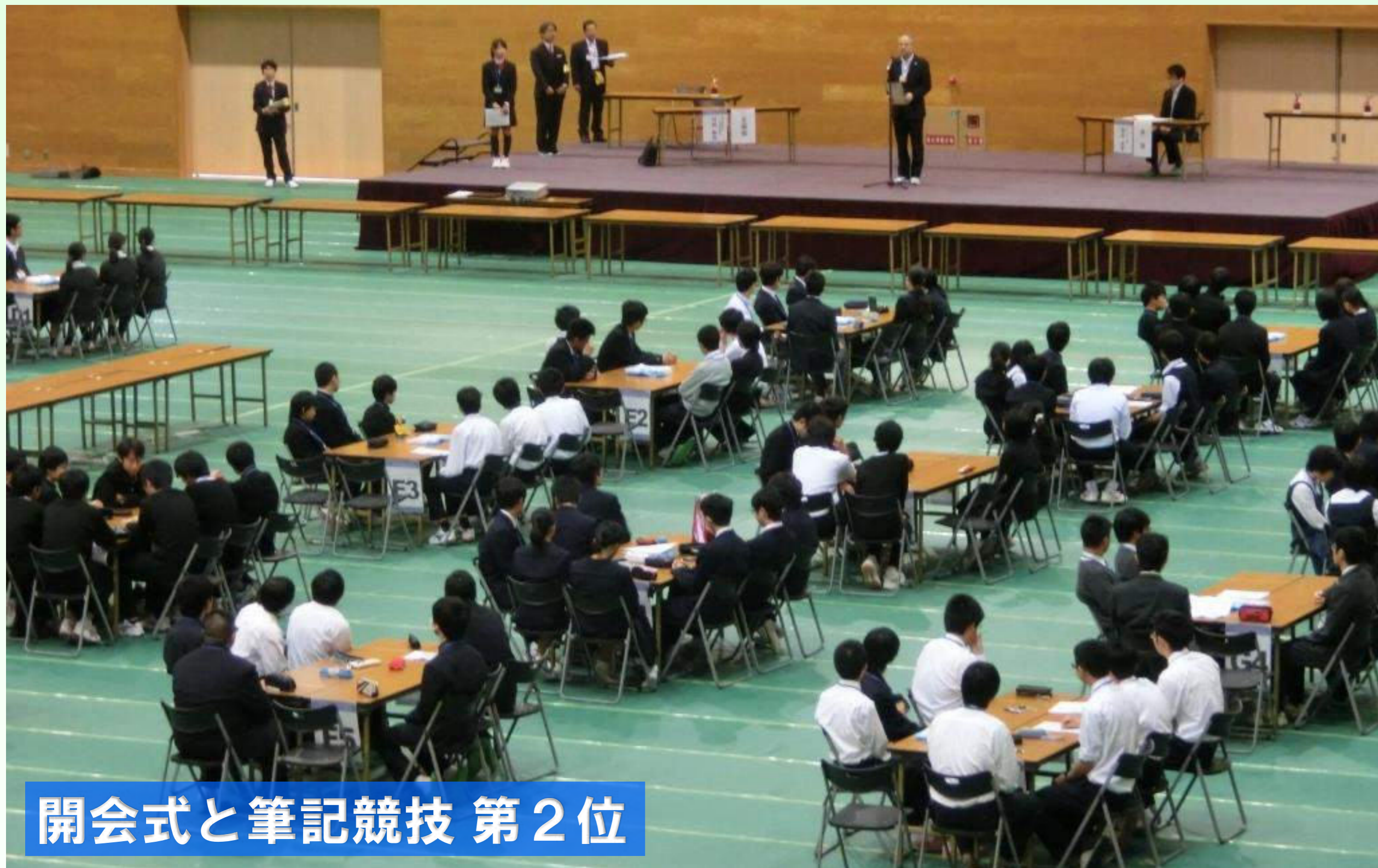
開会式と筆記競技 第2位