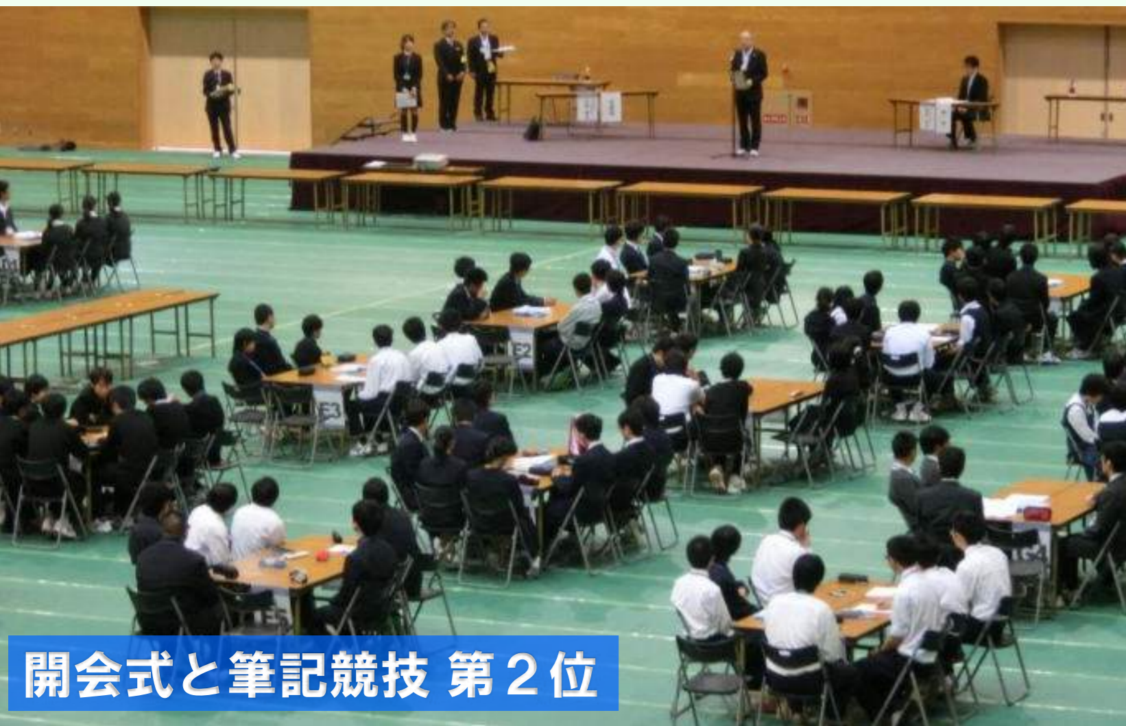
開会式と筆記競技 第2位