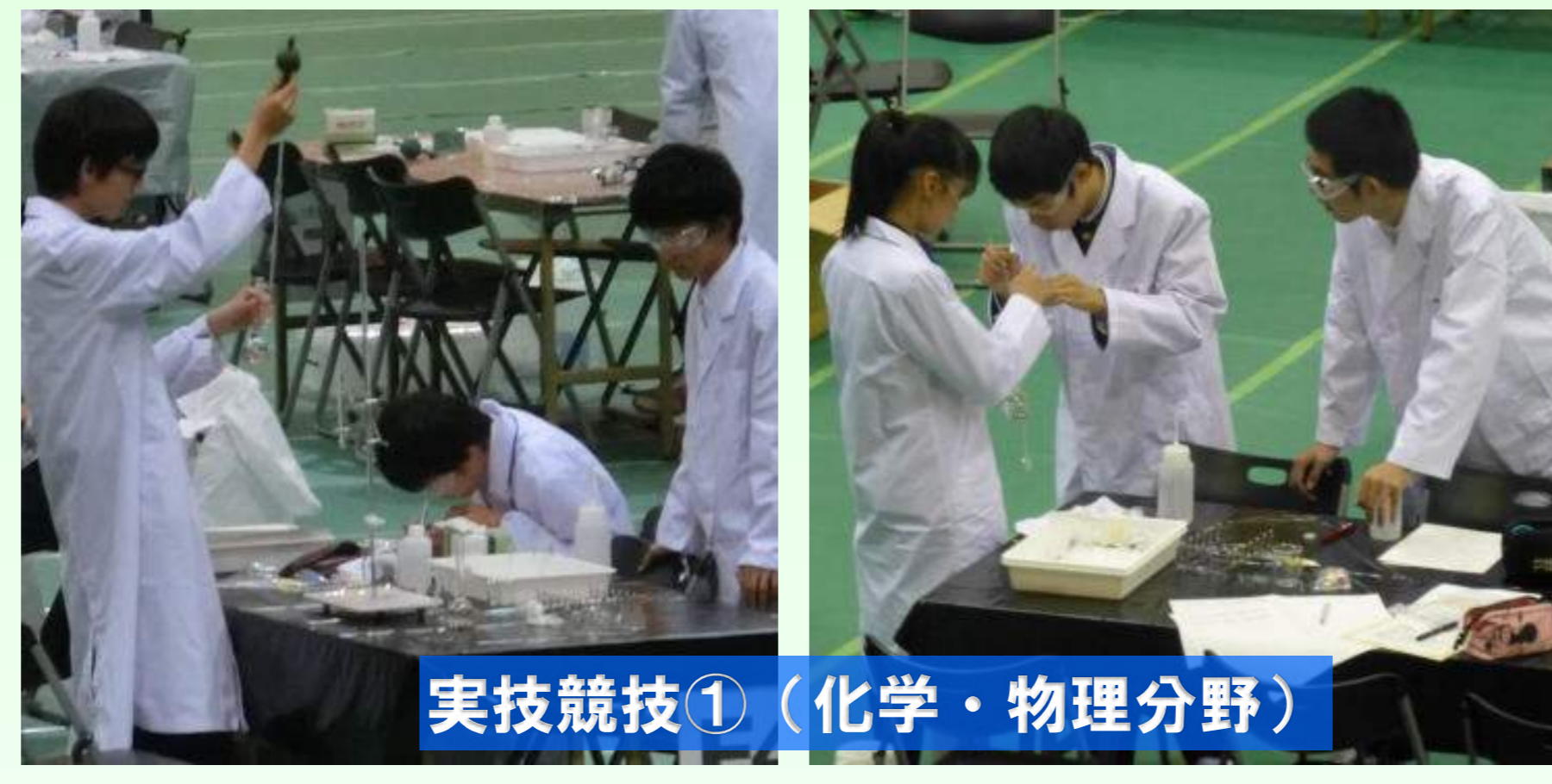
実技競技①（化学・物理分野）