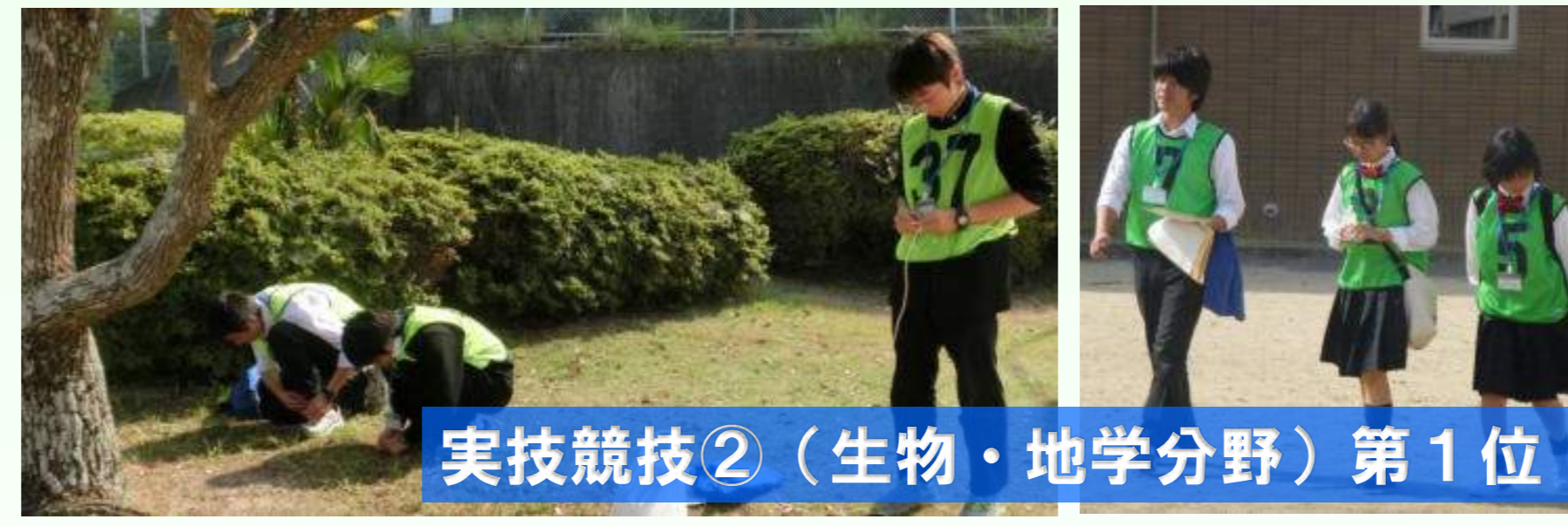
実技競技②（生物・地学分野）第1位