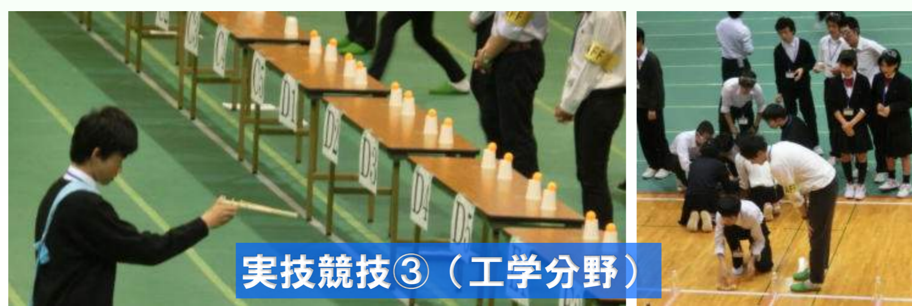
実技競技③（工学分野）