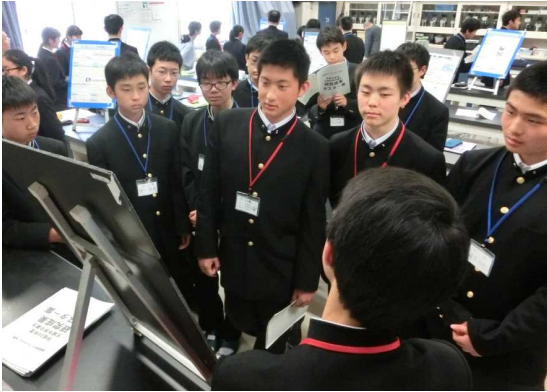
グループ形成のためのポスターセッション

創生研究では、特にグループの形成や研究テーマの設定、研究計画（ロードマップ）作成等、様々な場面での話し合い（ディスカッション）や研究メンバー相互の研究内容についての共通理解を重要な観点にしている。ディスカッションの中で学習し合うことで、早期の学習目標の到達と、「気付き」によるグループ全体の研究内容の質的向上を狙いとしている（←従来のCASEの要素を取り入れた活動）。