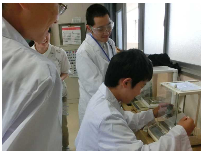
実験で検証する（発展研究）