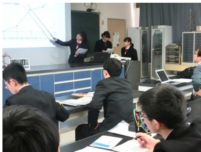
研究経過を発表する（発展研究）