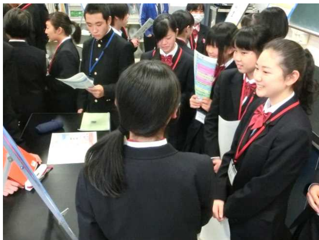
「研究テーマ」を探るポスターセッション（創生研究）