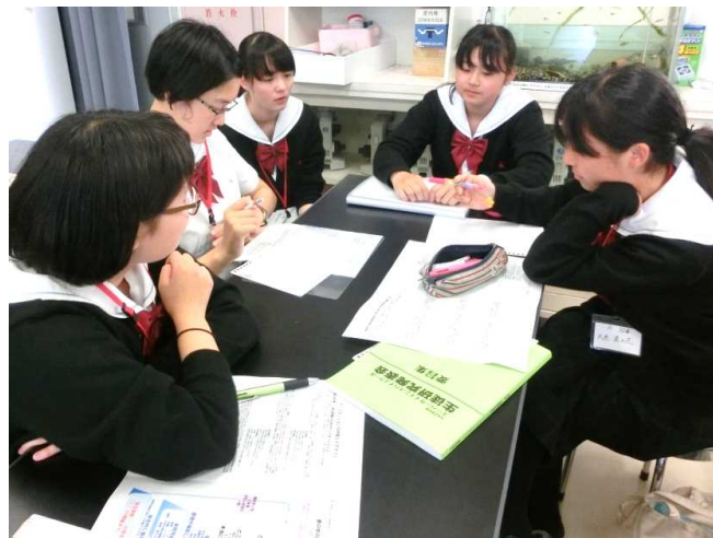
「研究テーマ」を探るディスカッション（創生研究）