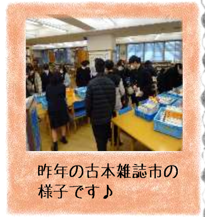
昨年の古本雑誌市の様子です♪

11月の読書くじには、たくさんの方が参加してくれてありがとうございました。12月は 12日(火)~14日(木)の3日間 、年に一度の古本雑誌市を開催します。図書館の古本や、雑誌のバックナンバーを皆さんにお譲りします。欲しい雑誌や古本を選んでくださいね。雑誌は数に限りがあるので、他の人のことも考えて持ち帰りましょう。(雑誌は 初日のみ一人2冊まで でお願いします☆)